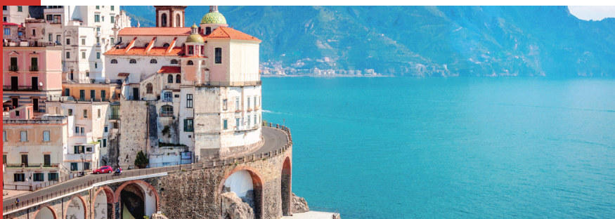
Cette photo est intégrée dans un but illustratif. Elle ne représente pas un actif détenu par la SCPI Novapierre Italie.